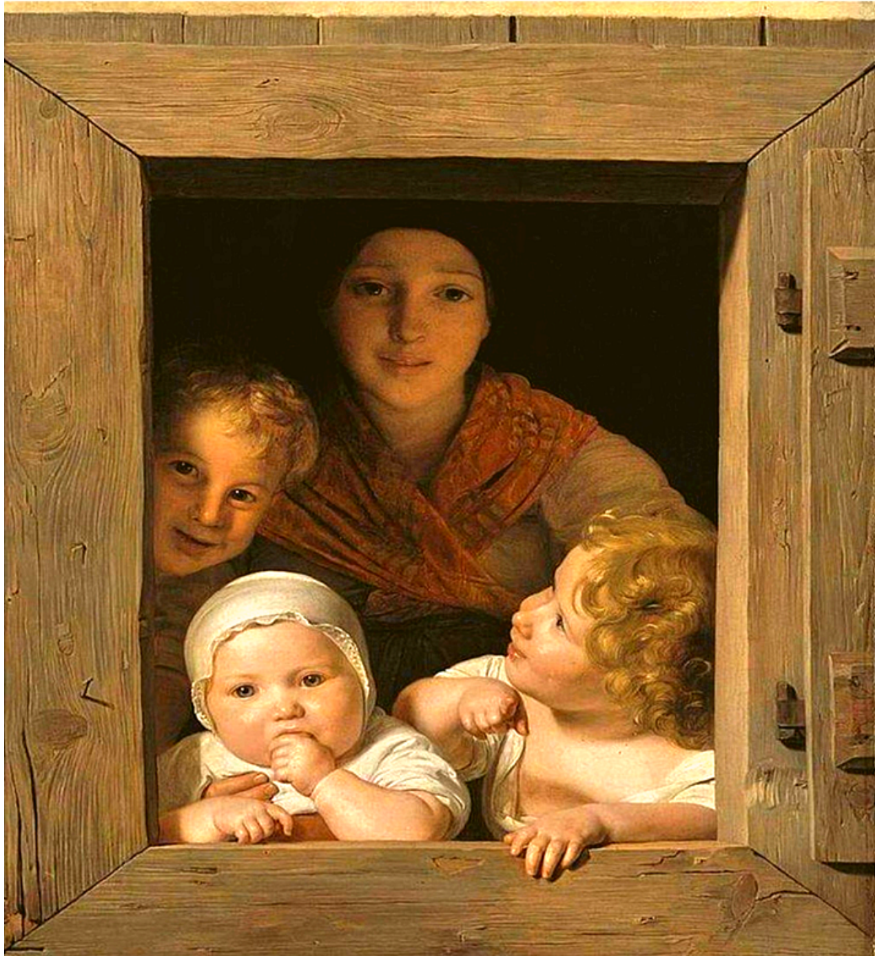
Ferdinand Georg Waldmüller, Giovane contadina con tre figli alla finestra , 1840

È lei, la madre, infatti che si frappone tra l'oscurità e i suoi figli, è lei che porta i figli alla finestra, è lei che spinge a guardare oltre le proprie prigioni. La finestra diventa così uno spazio di confine aperto. Tra il dentro e il fuori. Tra come si percepisce il mondo e come il mondo realmente è. La finestra è attesa. E possibilità al tempo stesso. Di aprire il cuore e lasciarsi toccare da orizzonti di Speranza: scegliere di aprire la porta, scendere le scale e uscire in strada è perciò, non soltanto, avere coraggio, né solo capacità di mettersi in discussione, ma soprattutto, è lasciarsi sorprendere! È fare l'esperienza dell'altro e, assieme all'altro, di Dio. Perché tutto si spiega solo quando è in relazione.