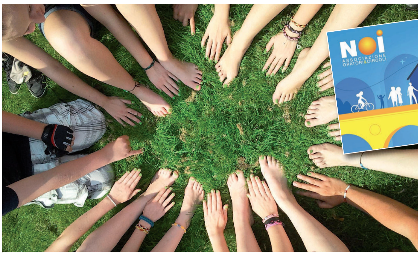
Nell'immagine a lato: la tessera 2021 di Noi Associazione

Dopo aver provato la fragilità di questo tempo occorre impegnarsi di più perché bambini e adulti si sentano sempre e comunque parte della grande famiglia della Chiesa